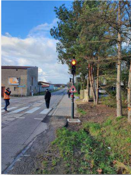
Carrefour du moulin, mise en service des feux tricolores le 20 janvier 2022