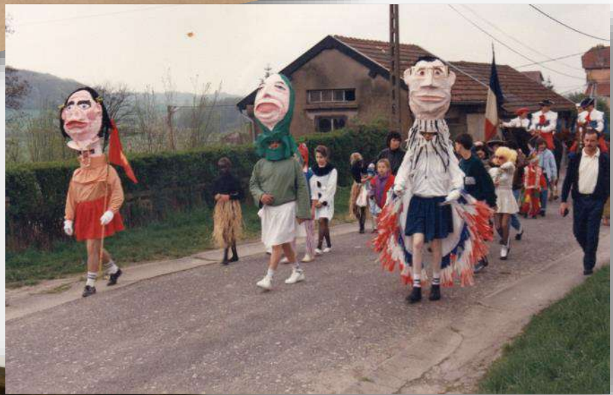
Les grosses têtes