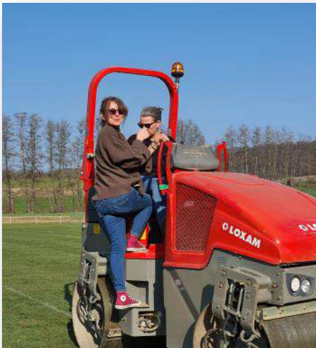
Nos adjointes se sont misent au travail pour rouler le terrain de football après les inondations pour que notre équipe puisse défendre haut et fort nos couleurs