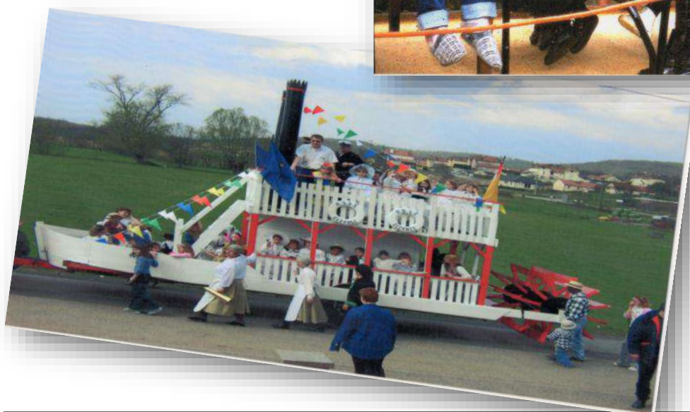
La navigation à aubes