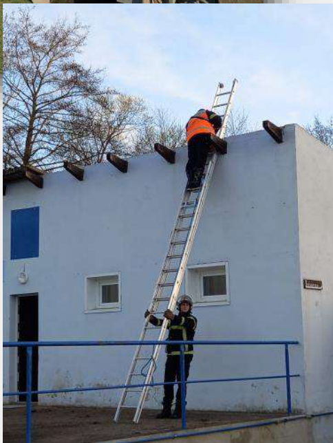
La tempête et la neige ont eu raison de la toiture des vestiaires du stade. Les pompiers sont intervenus pour bâcher et une entreprise a été sollicitée pour refaire la toiture. Restera encore à faire l'isolation.