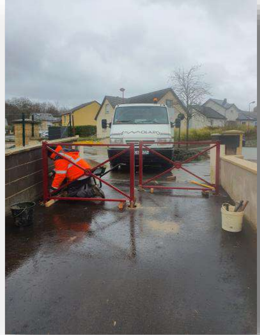
Mise en place d'une chicane sur le sentier reliant la RD2 à la rue des Vosges