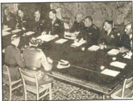
La capitulation sans condition de l'armée nazie, le 7 mai 1945, à Reims. De dos, le général Jodl et l'amiral von Friedeburg.

« C'est exactement le 7 mai 1945, à 2 h 41 du matin, que l'acte de reddition de l'armée allemande a été signé par le Général JODL à Reims. Plus de cinq années de souffrances terribles prenaient fin. La Moselle annexée, par conséquent notre commune, ainsi que l'Alsace rejoignaient la France. » c'est par ces paroles que le maire a commencé son allocution devant le monument aux morts, en s'adressant à un petit groupe d'Elzangeois, à une vingtaine d'élèves, ainsi qu'à des délégations des pompiers, des portes drapeaux et du monde combattant. Et voici sa conclusion ; « Oui notre commune a subi la barbarie de ce conflit, spécialement lors des combats de 1944 : nos 78 Ukrainiennes tuées par un bombardement au camp, plusieurs dizaines de soldats français, alliés, allemands, les maisons détruites, comme le bâtiment de la mairie-école...je terminerai par un message d'espoir, toujours valable : il faut tourner la page, croire en l'Europe, mais ne pas