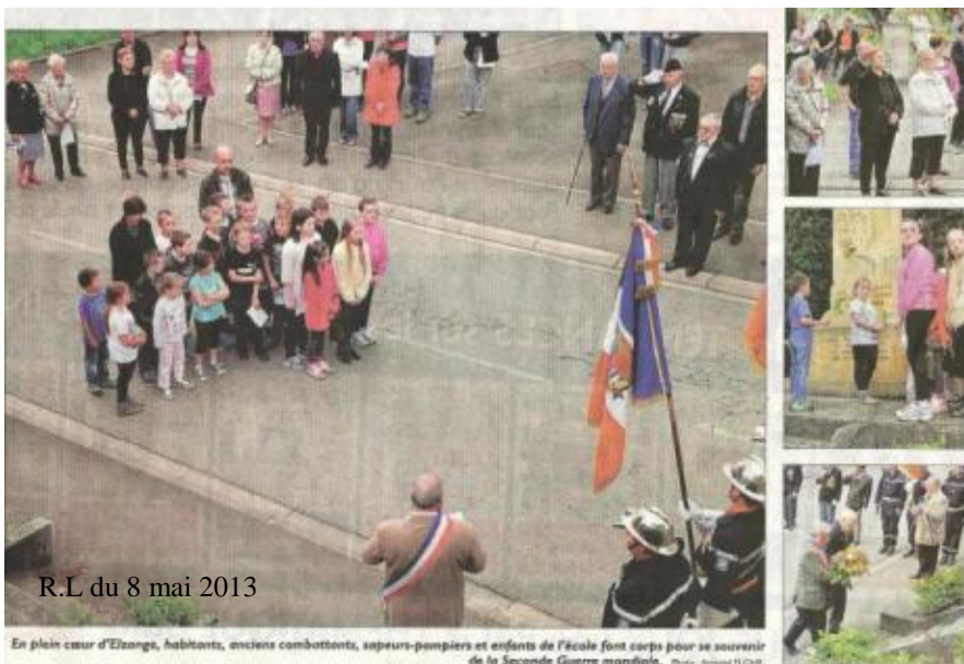
R.L du 8 mai 2013

Cette œuvre ne fut jamais installée, et aujourd'hui personne n'est en mesure de dire où elle se trouve !